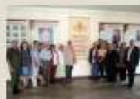
Дом офицеров Ульяновского гарнизона г. Ульяновск (июль 2019 г.)