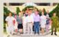
Дом офицеров (поселок имени Жукова) гарнизона г. Курск (июнь 2019 г.)