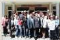
Дом офицеров Владикавказского гарнизона, г. Владикавказ (май 2019 г.)