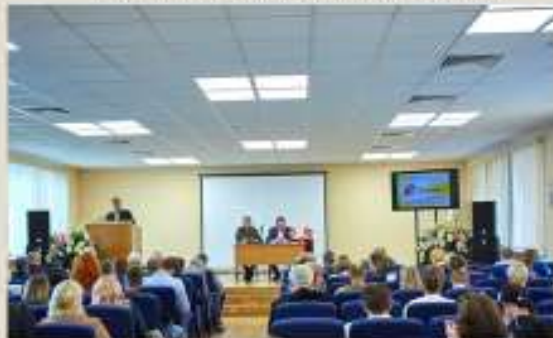
Центральный Дом Российской Армии

Семинар с работниками культурно-досуговой работы Министерства обороны Российской Федерации по взаимодействию с детско-юношеским движением «ЮНАРМИЯ»