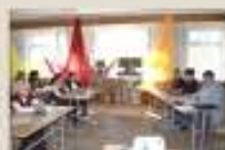
Дом офицеров Ковровского гарнизона г. Ковров (сентябрь 2019 г.)