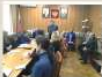
Дом офицеров Центрального военного округа, г. Екатеринбург (январь 2019 г.)