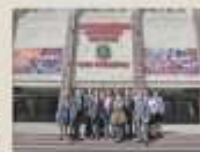
96 Дом офицеров Каспийской флотилии, г. Астрахань (апрель 2019 г.)