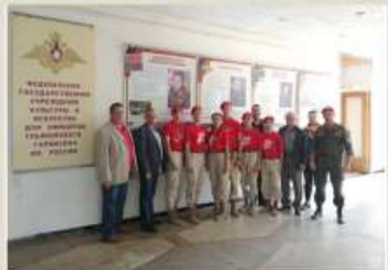
Оказание помощи в организации ритуала вступления в ряды движения «Юнармия» сотрудникам Домов офицеров гарнизонов