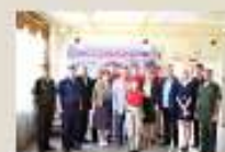
111 Дом офицеров (гарнизона) г. Мишлерово (август 2019 г.)